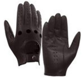
Braun Ziegenleder oder Hirschleder