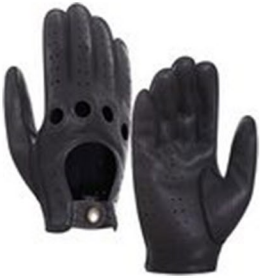
Schwarz Ziegenleder oder Hirschleder